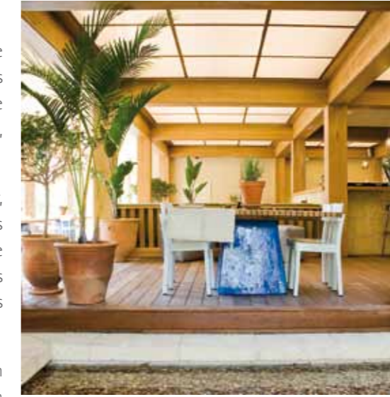
THALASSO SPA AREA

El circuito termal se complementa con un Hamman (Baño Turco), Saunas, Duchas Escocesas, Pileta de Agua Fría y Solarium al aire libre.