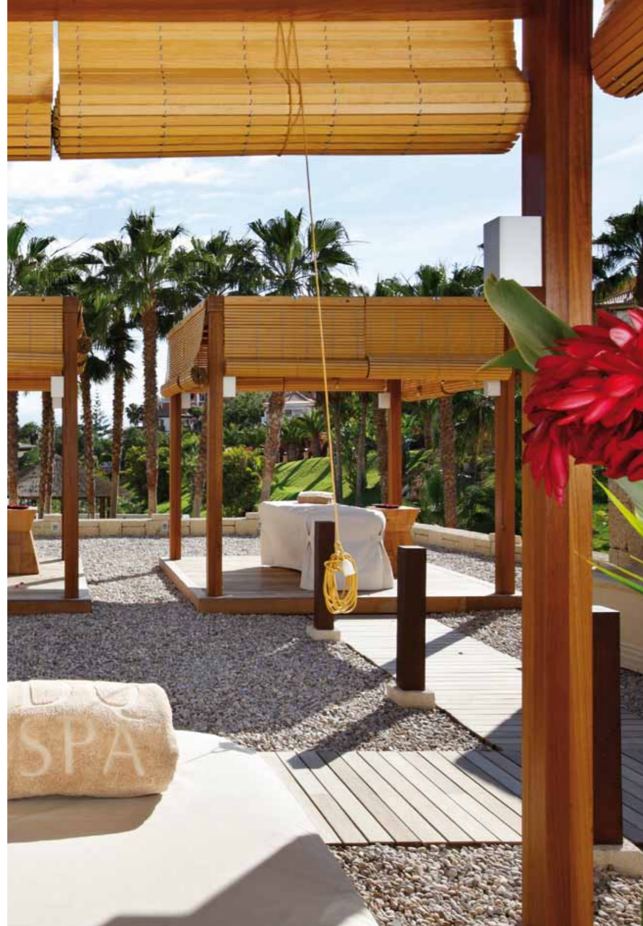
Outdoor Treatment Cabanas

The prestigious international consultancy firm, ESPA, has used local elements to create signature treatments and exclusive rituals, inspired by the marvellous climate and natural landscape, using aloe vera in the nourishing, calming Aloe Vera and Banana Leaf Ritual that helps to calm, refresh and hydrate your skin. The exclusive Thalassotherapy suites offer a selection of treatments based on the therapeutic benefits of Tenerife seawater. The Thalassotherapy Ritual is rich in minerals and helps to tone, restore balance and de-stress your mind and body.